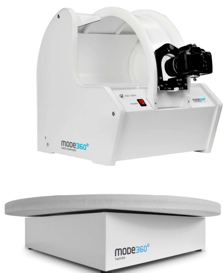
Photo Composer to kompaktowe urządzenie posiadające własne oświetlenie fotograficzne LED, stół bezcieniowy z platformą obrotową do zdjęć 360 stopni oraz ramię do zdjęć sferycznych 3D.

Oferta MODE SA zorientowana jest na rozwiązania do fotografii produktowej, wizualizacji cyfrowej oraz narzędzi do prac konserwatorskich przy ochronie zabytków oraz dla rynku medycznego i kosmetycznego.